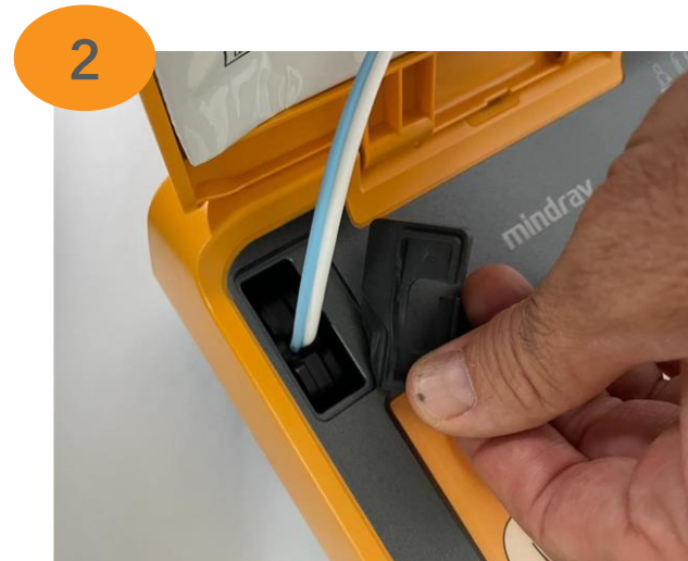
Retirar la tapa protectora