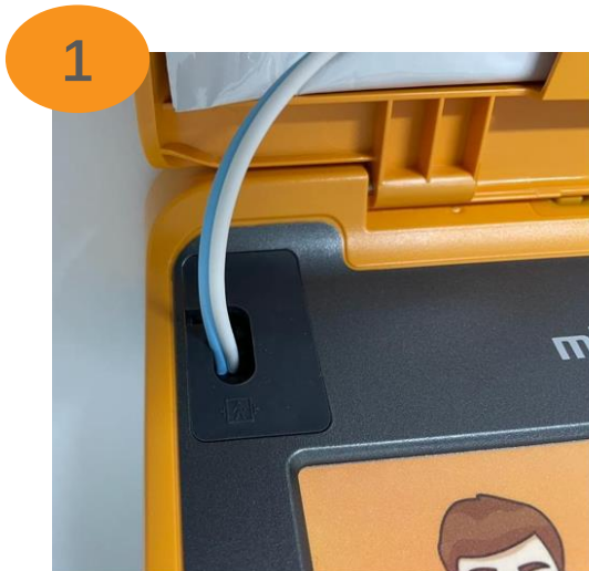
Localizar el Conector