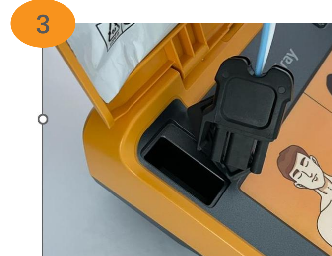
Desconectar el Electrodo existente y reconectar el nuevo